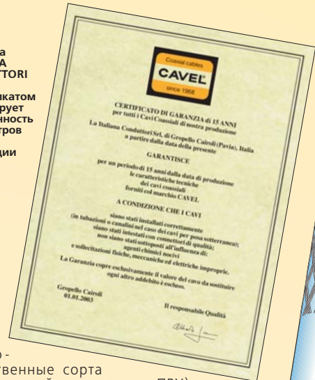
Фото 1. Фабрика ITALIANA CONDUTTORI данным сертификатом гарантирует неизменность параметров всей продукции CAVEL в течение 15 лет.

низко-качественные сорта PVC (в русской транскрипции: ПВХ), а это приводит к газовыделению, столь характерному для китайской продукции: китайские кабели «пахнут» . Они пахнут (газят) с неизменной интенсивностью на протяжении многих лет, и, будучи уложенными в жилых помещениях, увеличивают риск приобретения различных легочных заболеваний.