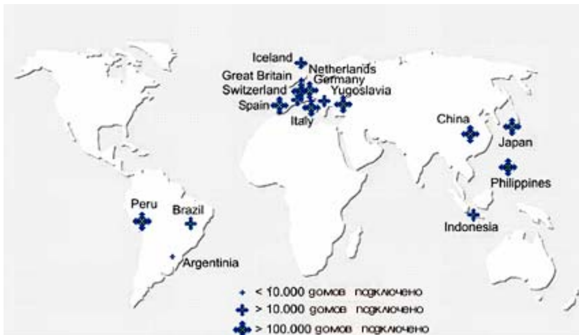
Рис. 1. География реализованных проектов компании VKtel.

На оборудовании VKtel реализованы десятки проектов по строительству крупных современных телевизионных мультисервисных сетей, как на основе классических гибридных волоконно-коаксиальных (HFC) решений, так и с использованием технологий волнового уплотнения CWDM и DWDM, включая PON-сети ( Рис.1 ). Оборудование VKtel известно именно своей исключительной надежностью и очень высокими характеристиками.