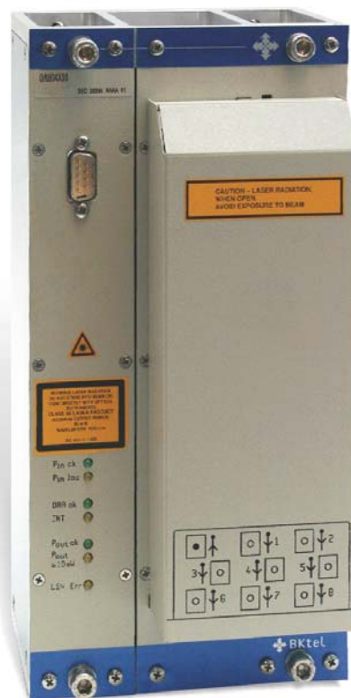
Рис. 4. Оптический усилитель (тип ОАН).