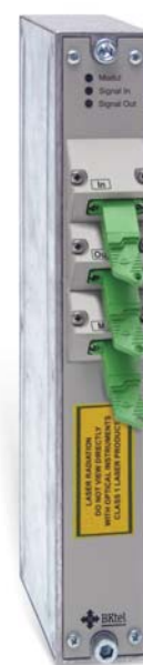
Рис. 8. Оптический усилитель серии BaalMega (тип BOA).