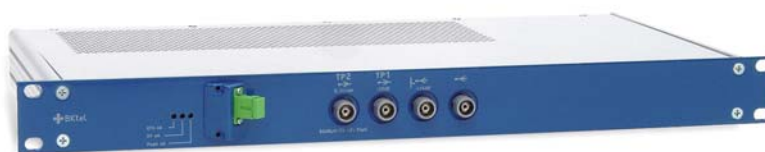
Рис. 5. Оптический передатчик с внутренней модуляцией (тип VOT).

В продукции VKtel уже учтены все нюансы эксплуатации в России и предусмотрена защита от всех возможных и невозможных внештатных ситуаций. Взять хотя бы разнообразные конфигурации блоков питания. Вы заказываете именно такую схему резервирования по питанию, которая используется в Вашей головной станции. Вы можете совсем отказаться от резервного блока питания, а можете заказать установку двух одинаковых блоков с питанием от сети напряжением 100..220В или один из блоков питания будет работать от системы бесперебойного питания с постоянным напряжением 48В (а может быть и 24В).