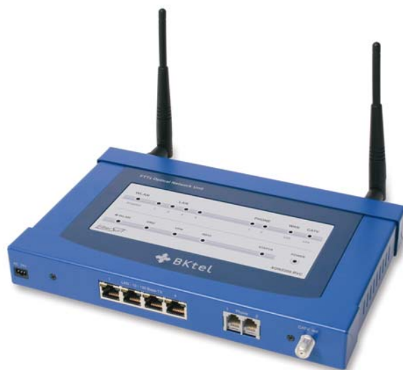
Рис. 9. Ethernet трансивер серии BaalFTTx (тип XON).

Поддерживаются следующие стандарты/протоколы: Ipv4, TCP, UDP, DHCP, NAT, IGMPv2, PPPoE, PAP, CHAP, SIP 2.0, G.711, G.723.1, G.729a/b, RTP/RTCP, TFTP, HTTP, SNMP v1,