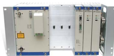
Рис. 2. Шасси серии 1570BB с установленными модулями.