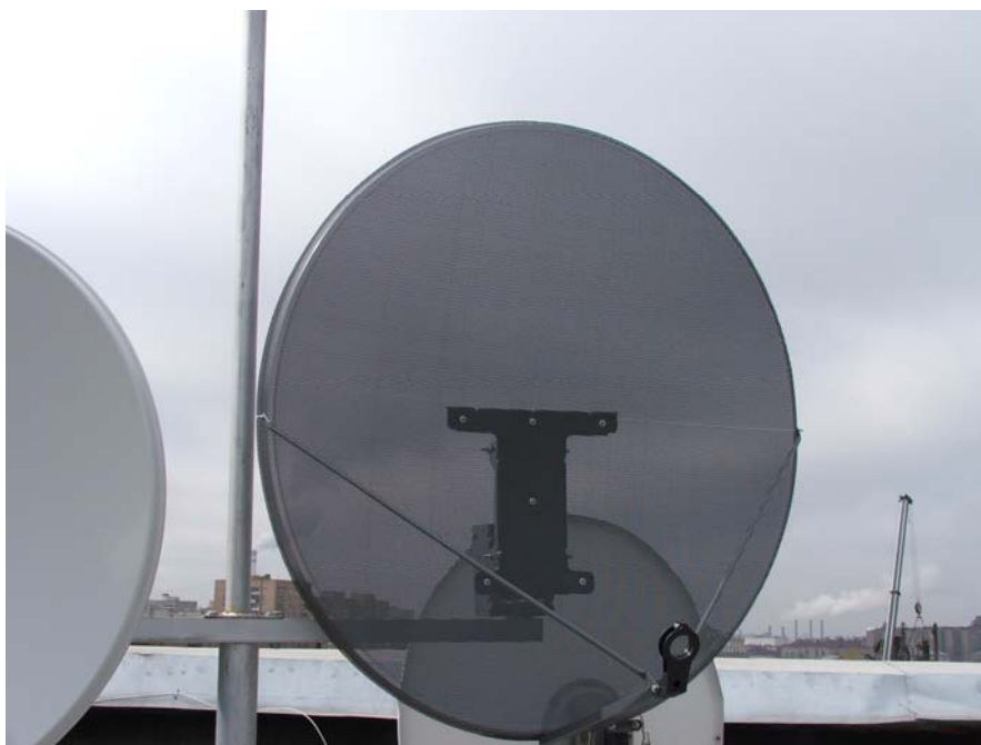
Рис.1 Оффсетная перфорированная антенна LANS-120