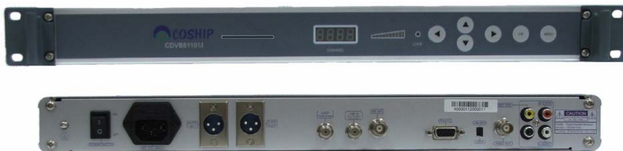
Рис.5 Профессиональный спутниковый приемник Coship CDVB 5110M

Обращаем внимание: При вещании по кабельной сети аналогового сигнала абонентам кабельной сети дополнительное оборудование не понадобится.