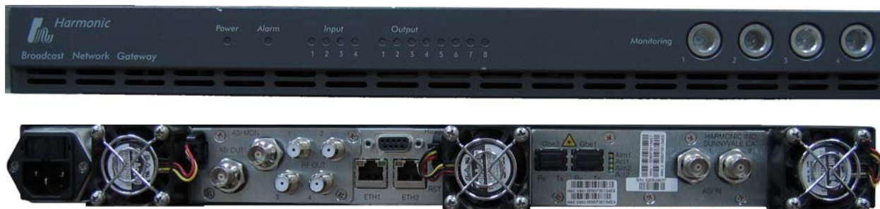
Рис.3 многофункциональный интегрированный шлюз BNG

Здесь мы используем для приема со спутника IRD Harmonic ProView PVR 4000 или, например, Coship CDVB5110M или 5110G, LCT DSR2000CI или аналогичных от другого производителя, оборудованного ASI-выходом (вопрос пристрастий и финансовых возможностей оператора), а для формирования «кабельного» сигнала многофункциональный интегрированный шлюз BNG 6104 (1xGbE и 2xASI в 4 QAM-RF).